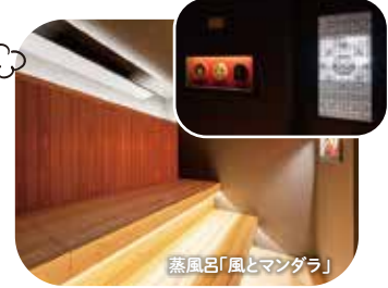
蒸風呂「風とマンダラ」