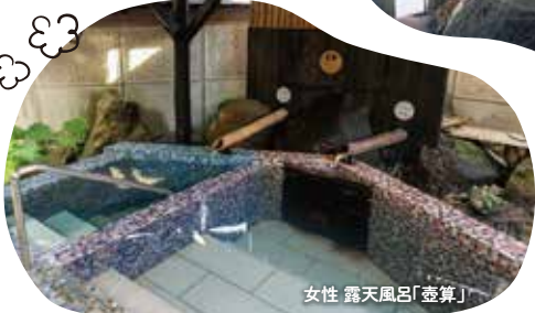
女性 露天風呂「壺算」