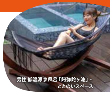
男性 低温源泉風呂「阿弥陀ヶ池」・ととのいスペース

温泉の熱を体の芯に届け、のぼせず長湯が楽しめる。源泉温冷浴を楽しめます。35度の源泉のみの低温源泉風呂と適温の湯船を交互に入り、ととのいスペース (男性のみ) でお寛ぎください。