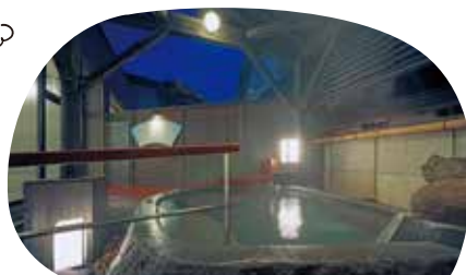
男性 露天風呂「あたま山」

男性用は、蔵王石をくりぬいた岩風呂「あたま山」とモザイクタイルの深めのぬる湯「阿弥陀ヶ池」。女性用は、モザイクタイルで仕切り、ぬる湯を併設した「壺算」。冬は、雪見風呂に。