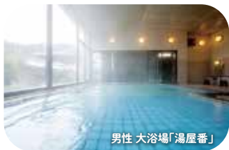
男性 大浴場「湯屋番」

源泉100%掛け流しの大浴場。手すりとスロープがあり、寝湯と半身浴も。広々湯船をお楽しみください。