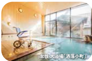
女性 大浴場「洒落小町」